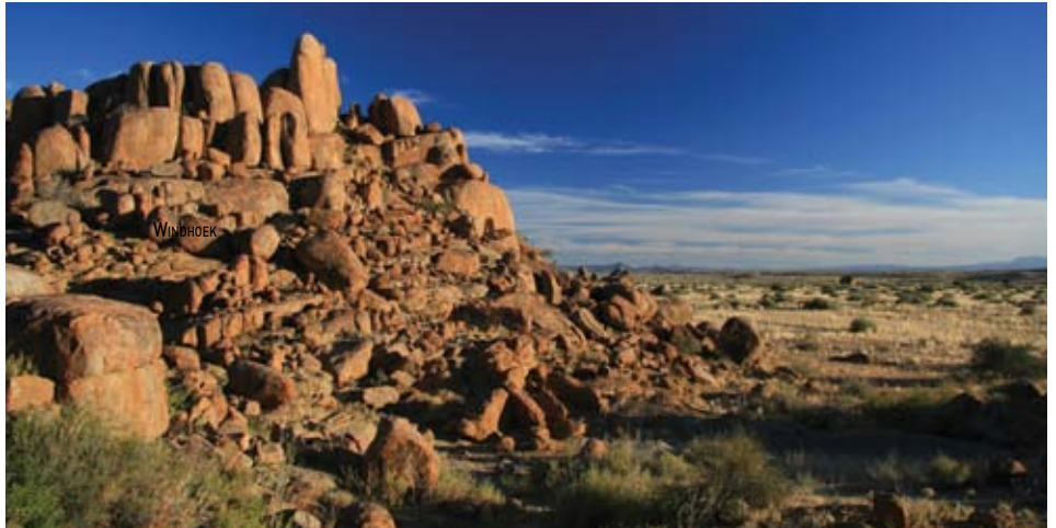
Canyon de Fish River

INCLUANT Safari photo dans le parc national d'Etosha