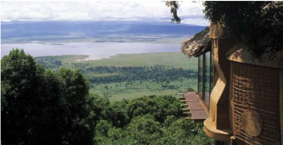
Le Ngorongoro Crater Lodge