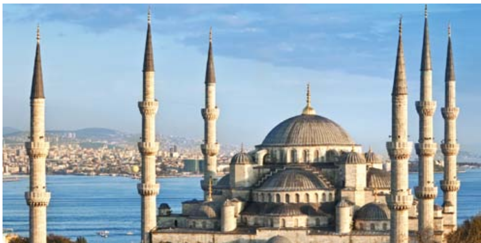
Mosquée Bleue à Istanbul

Quoi de mieux que d'apprendre en voyageant. Peu de pays peuvent se vanter d'avoir une histoire aussi riche que la Turquie. Ce pays mi-européen, mi-asiatique offre des villes fascinantes, des sites archéologiques uniques, des paysages à couper le souffle et des sites balnéaires enchanteurs. Les Découvertes Ottomanes sont un réel kaléidoscope d'un pays aux multiples facettes. Les amateurs d'histoire et de culture seront ravis.