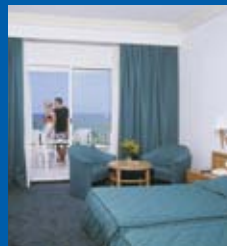
El Mouradi Hammamet Resort 5*