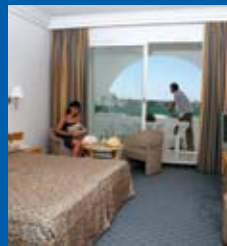
El Mouradi Palace 5*