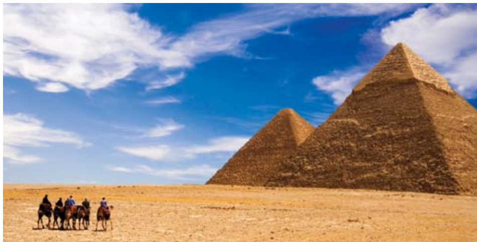
Pyramides de Guizeh