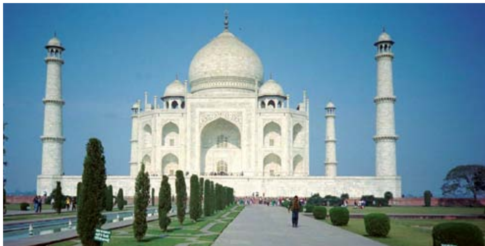
Taj Mahal - Agra