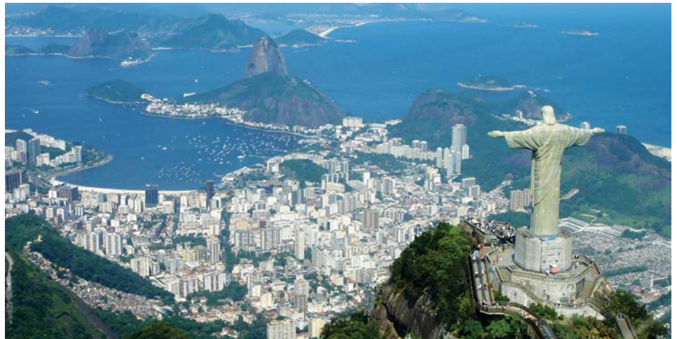
Ville de Rio de Janeiro