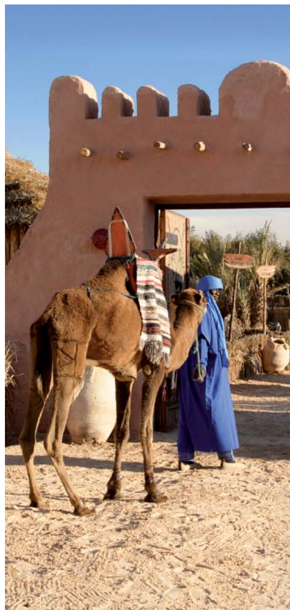
Le campement Zaafrane