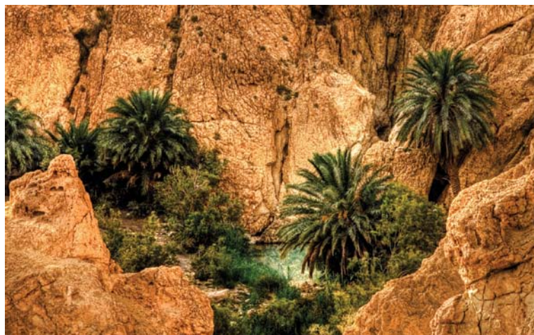
Oasis montagneuse de Chebika