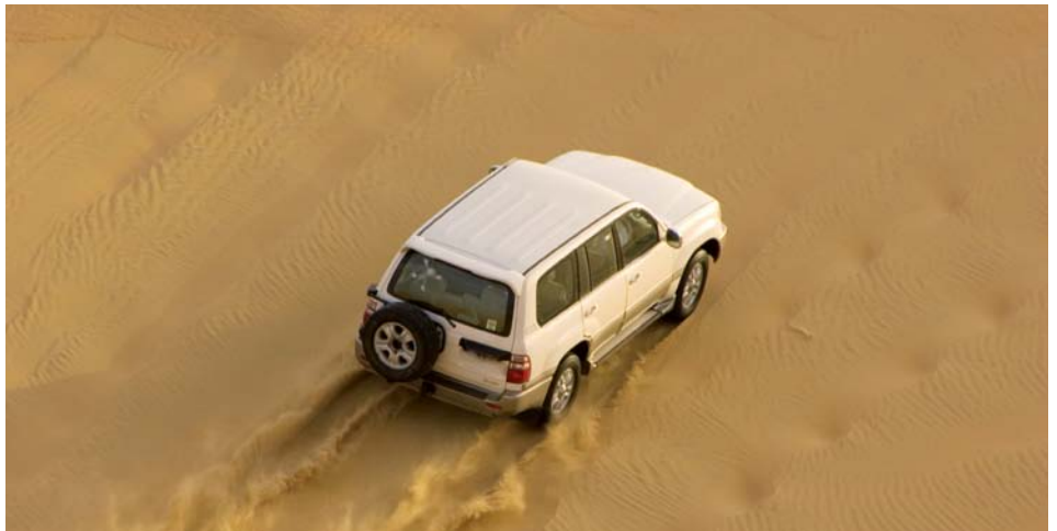
Circuit en 4x4 dans le sud tunisien