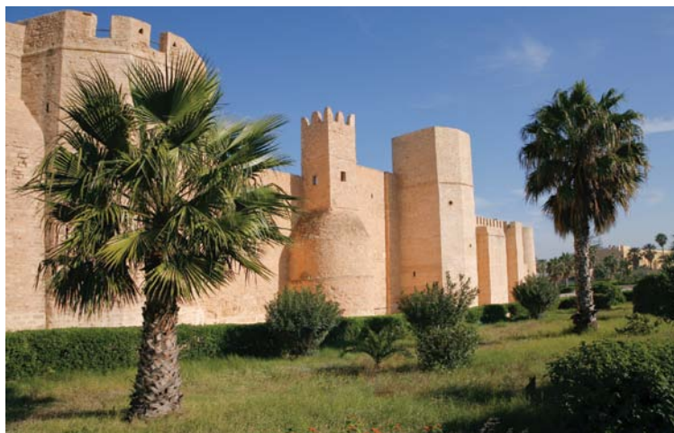
Le Ribat, ancienne forteresse arabe