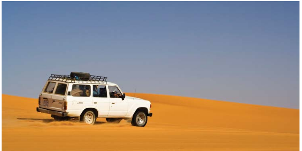
Le grand désert en 4X4