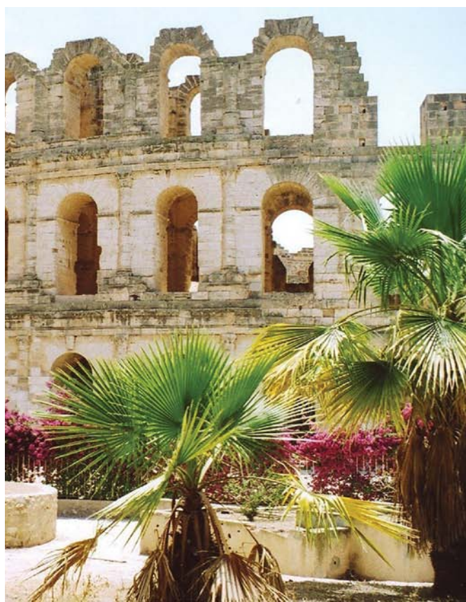
Colisée de El Jem

Partez avec votre famille ou vos ami(e)s en circuit privé • Lors de votre séjour ajoutez du golf, des nuitées d'hôtels ou des excursions à votre forfait en Tunisie. Détails page 12