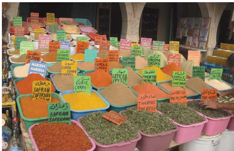
Gabès, marché aux épices