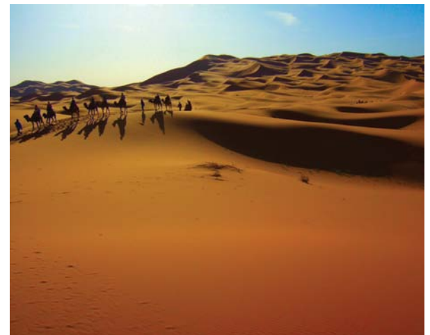
Région de Douz

Jour 15 Hôtel de séjour 75 ou 150 km • Tunis • Montréal • Transfert à l'aéroport de Tunis pour votre vol de retour vers Montréal avec correspondance à Casablanca. Arrivée à Montréal en fin de journée. (PD)