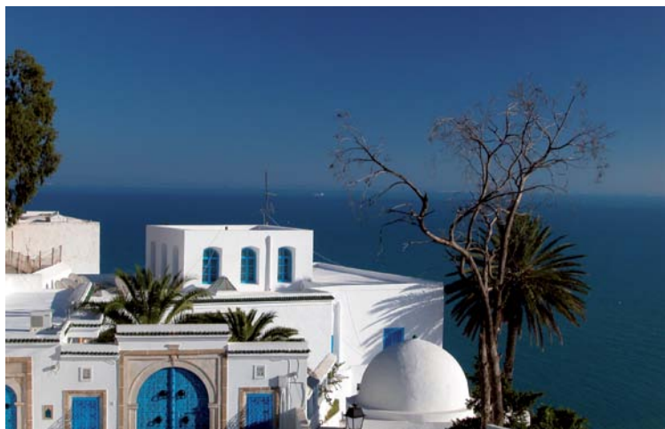
Sidi Bou Said