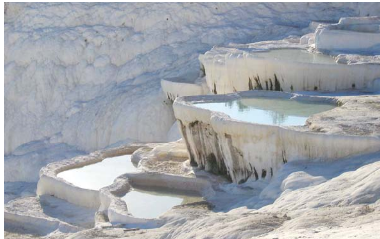
Cascades d'eau chaude de Pamukkale