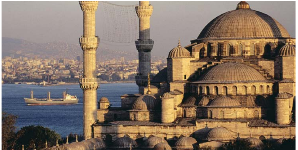
Mosquée Bleu à Istanbul