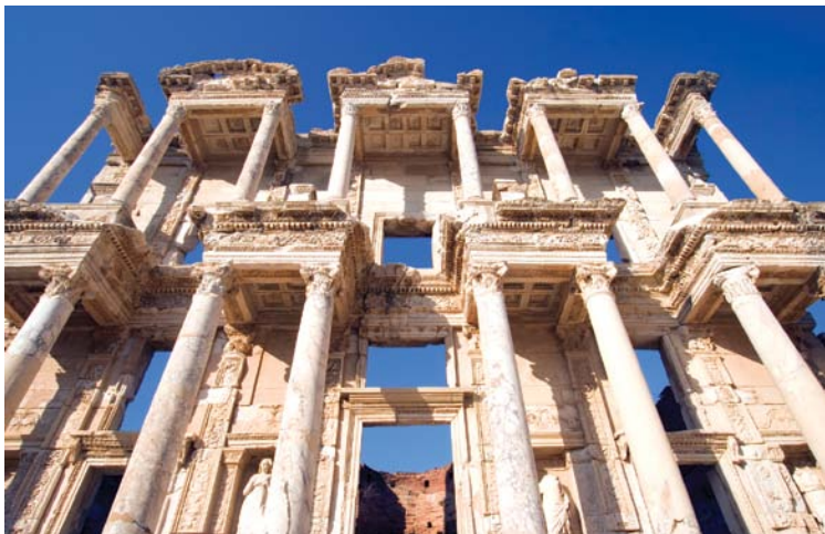
Site archéologique de Éphèse