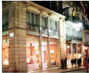
Barcelone - Rialto 3* 4 nuits