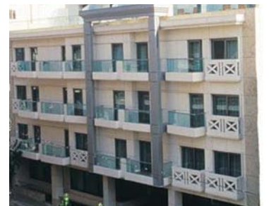
Athènes - Heradion 4* 4 nuits