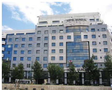
Lisbonne - Mundial 4* 4 nuits