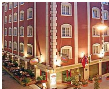
Istanbul - Romance 4* 4 nuits