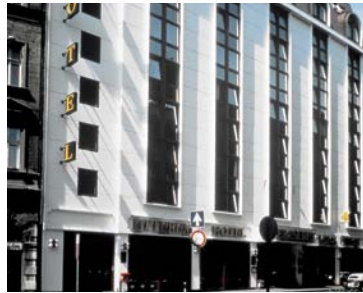
Budapest - Erzsebet 3* 4 nuits