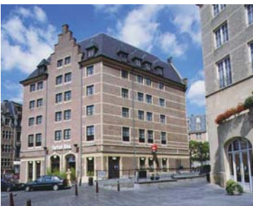
Bruxelles - Ibis Off Grande Place 3* • 4 nuits