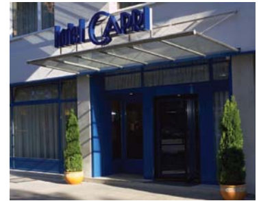
Vienne - Capri 3* 4 nuits