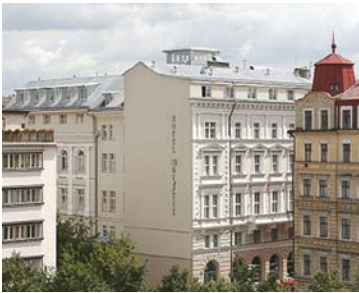
Prague - Le Christie 4* 4 nuits

Vous avez envie de mieux connaître les grandes villes européennes? D'y visiter des musées, de découvrir des monuments historiques impressionnants ou simplement de déambuler dans les rues à la recherche de nouvelles boutiques, restaurants, discothèques, parcs... Notre programme « Les Grandes villes d'Europe » combinant 4 nuits en hôtel 3* à Paris ou à Londres et 4 nuits en hôtel 3* ou 4* dans une autre grande ville européenne comblera toutes vos attentes.