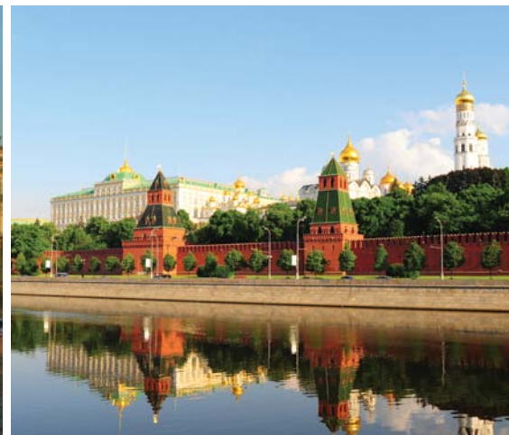
Moscou - Le Kremlin

Vous serez impressionné par les deux plus importantes villes de Russie. Moscou, la capitale, fondée en 1147, est située sur les rives de la Moskova. Saint-Petersbourg, fondée en 1703 et ancienne capitale pendant 200 ans, est située dans le delta de la Neva. L'une est imposante et majestueuse, l'autre est charmante et gracieuse.