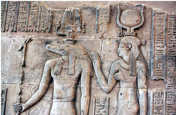
Kom Ombo (Sobek à tête de crocodile)