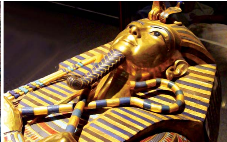
Le trésor de Toutankhamon