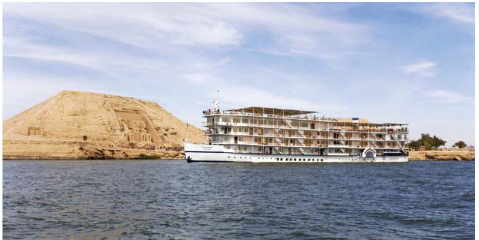
Le MS Prince Abbas à l'approche du Temple de Ramsès II