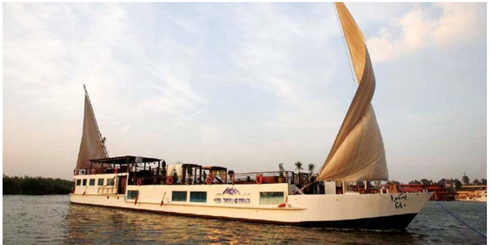
Croisière en « Dahabia » sur le Nil