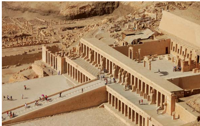
Le temple de la reine Hatchepsout à Deir-El-Bahari