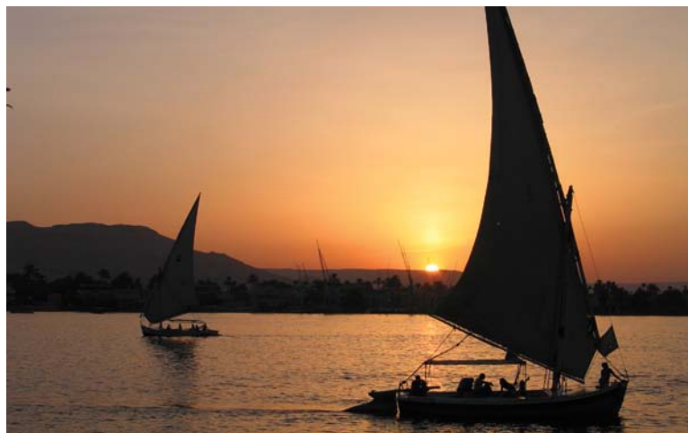
Naviguez sur le Nil à bord d'une felouque