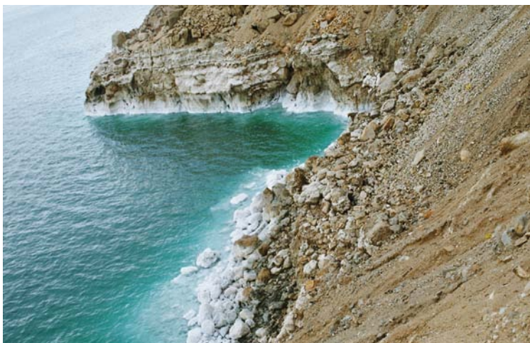
La Mer Morte