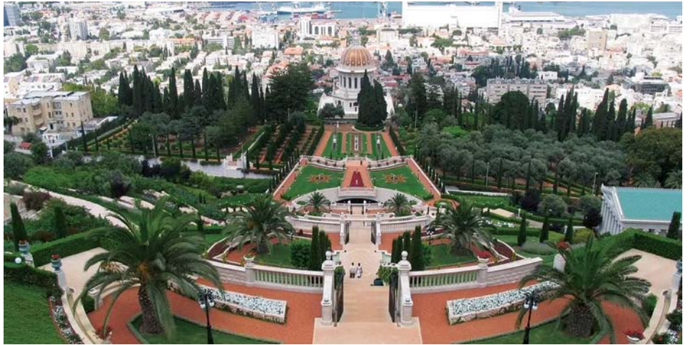
Le Temple Bahai