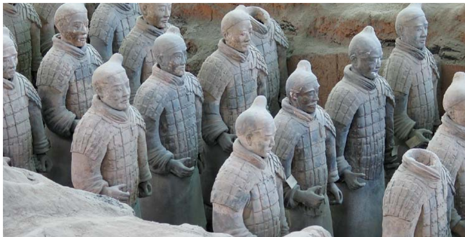
Mausolée de l'empereur Qing